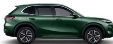
JUNGLE GREEN (ЗЕЛЕН) (H31)