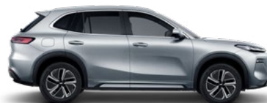
CLOUDVEIL SILVER (СРЕБЪРЕН) (H33)