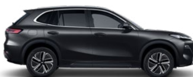
POLAR BLACK (ЧЕРЕН) (H28)