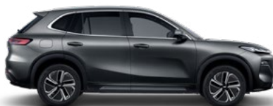
VOLCANIC GRAY (СИВ) (H29)