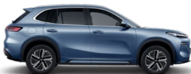
GLACIER BLUE (СИН) (H30)