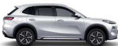
ALPINE WHITE (БЯЛ) (H32)